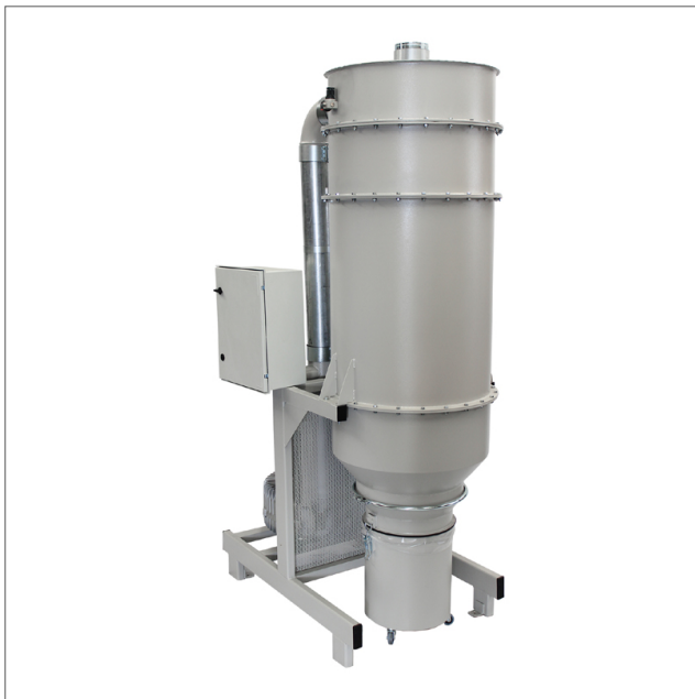
CE-18 - Suction unit

Käyttökohteet • Teollisuussivous • Hitsauskäryjen kohdepoisto • Hiontapölyille