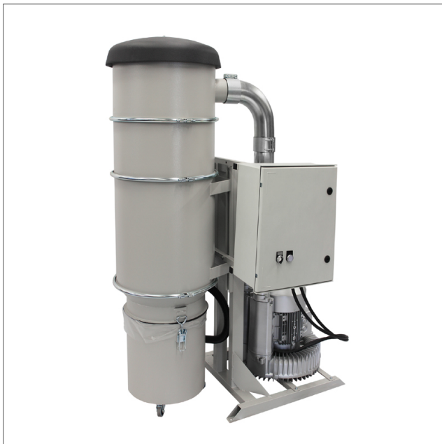
CE-3/CE-5 - Suction unit

Käyttökohteet • Teollisuussivous • Hitsauskäryjen kohdepoisto • Hiontapölyille