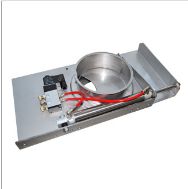
AUDS - Sliding damper pneumatic stainless AISI 304

Mikrokytkin asennettavissa Ø180 mm kokoon asti, tunnistimet sopivat kaikkiin kokoihin.